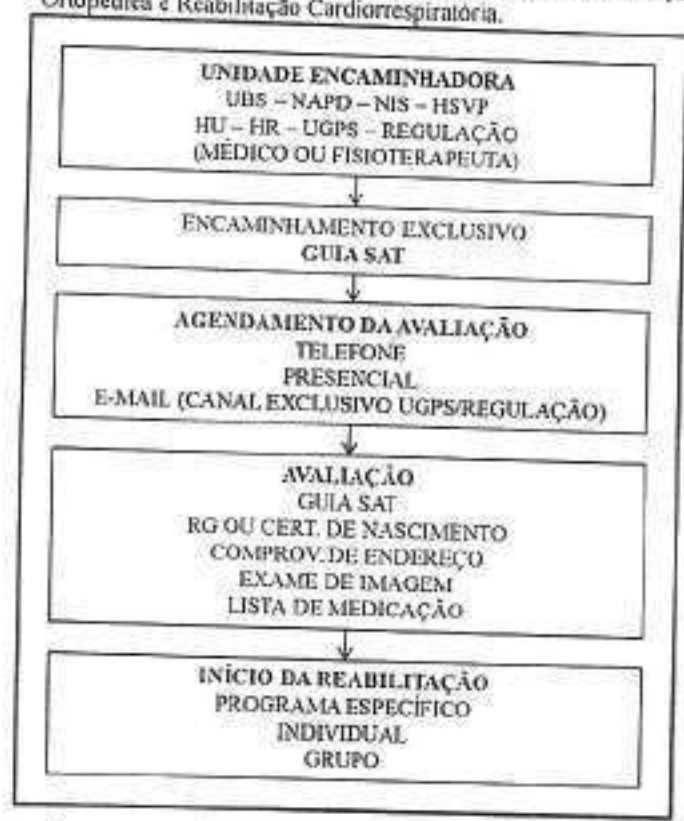
Fluxograma 1 - Modelo de encaminhamento à Reabilitação Ortopédica e Reabilitação Cardiopulmonar.

O Fluxograma 2 corresponde ao processo de reabilitação neurofuncional com porta de entrada na fisioterapia e/ou terapia ocupacional e/ou fonoaudiologia. O agendamento da avaliação é via agenda do Sistema Integrado de Informações Municipais (SIIM), exclusivamente, pelo Núcleo de Apoio à Pessoa com Deficiência para as especialidades supracitadas através de encaminhamento por Guia SAT (uma guia para cada segmento a ser tratado) fornecido por médico ou fisioterapeuta do Núcleo de Apoio à Pessoa com Deficiência.